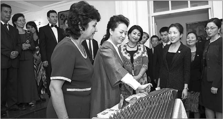
12日，习近平主席夫人彭丽媛参观塔吉克斯坦国立音乐学院，赠送中国传统乐器古筝时，拨动琴弦。

互联互通水平，建设好中国－中亚天然气管道，未来五年将双边贸易额提升至30亿美元。 拉赫蒙表示，塔方珍视同中方的睦邻友好合作，坚定发展两国战略伙伴关系。我感谢习近平主席的邀请，将赴华出席亚太经合组织东道主伙伴对话会。“三股势力”是塔中共同面临的威胁，两国要加大执法安全和防务合作，多开展联合行动，确保边界安宁。塔方希望积极参与丝绸之路经济带建设，发挥两国互补优势，推动电力、矿产、交通基础设施、跨境运输等领域务实合作，多开展共同加工、联合生产。 会谈后，习近平和拉赫蒙共同签署《中塔关于进一步发展和深化战略伙伴关系的联合宣言》，见证了经贸、农业、能源、基础设施建设等领域多项合作文件的签署。 习近平当天还会见了塔吉克斯坦总理拉苏尔佐达。习近平指出，中方提出的共建丝绸之路经济带倡议是互利共赢的，欢迎塔方积极参与。