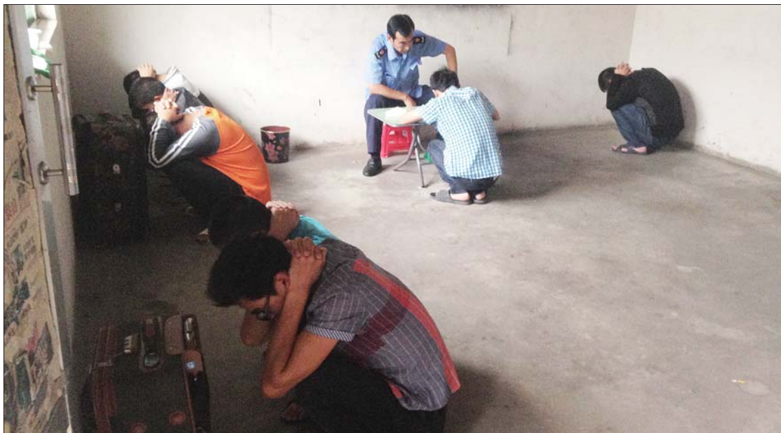
在泰安下旺村一窝点内,一些传销人员被查获。

办案民警已提前摸清部分窝点的位置,大队警车直奔这些窝点门口。每一处窝点前,部分警力进窝点清查,其他警力立即奔赴下一个窝点,行动进展非常迅速。很快整个下旺村疑似传销窝点的出租房几乎全被行动组控制。