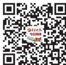
齐鲁晚报今日菏泽官方微信二维码

注齐鲁晚报今日菏泽官方微信——牡丹传媒, 将意见填写在对话框即可(最好注上联系方式)。方式二: 拨打电话: 18300581028。(本报记者 陈晨)