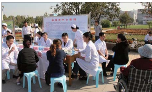
大型义诊活动惠及淄博市民(资料片)。

据市卫计委工作人员介绍,此次“服务百姓健康行动”大型义诊活动周是在总结去年大型义诊活动经验的基础上,因地制宜、紧密结合需求,有重点、有针对性开展的义诊活动。通过活动的开展,将进一步加强健康和医学知识的宣传普及,方便群众在家门口看病就医,提高群众满意度;提升服务质量