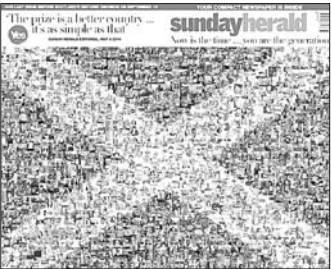
格拉斯哥《星期日先驱报》用无数张人头像构成一面苏格兰旗帜,这是唯一一家明确支持独立的英国报纸。