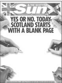
《太阳报》苏格兰版称,无论是赞成还是反对独立,18日,苏格兰从空白开始。