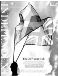
《独立报》将苏格兰与英国的关系称作“307年之痒”。