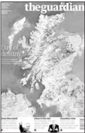
《卫报》将18日称为“命运日”,除苏格兰外的英国其他地区均被海水淹没。