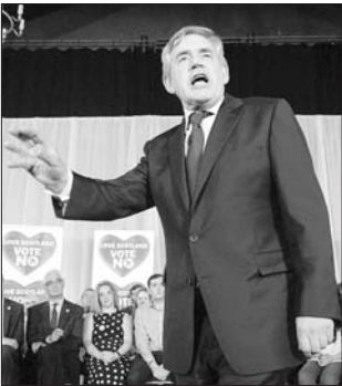
17日,在苏格兰出生的英国前首相布朗在苏格兰格拉斯哥发表呼吁反对独立的演讲。