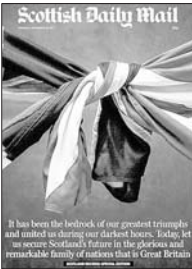
《苏格兰每日邮报》将英国国旗与苏格兰旗帜紧紧系在一起来表达支持统一。