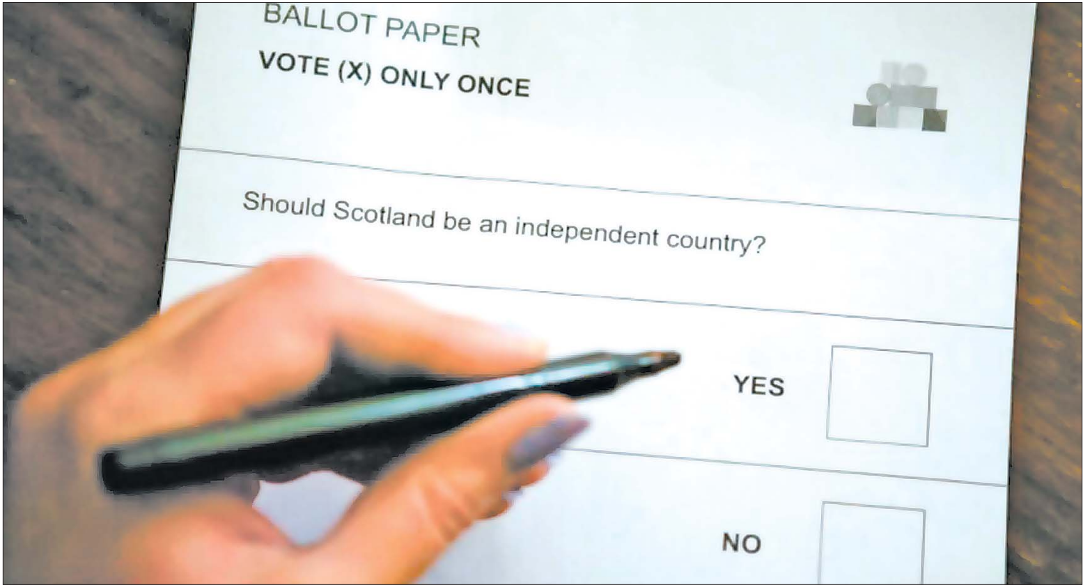
苏格兰独立公投当地时间18日7时开始。选票上只有一个问题,即“苏格兰应该成为一个独立的国家吗?”请用“X”标记“是”或“否”。