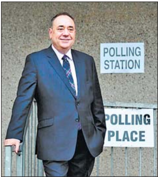
18日,苏格兰政府首席大臣萨蒙德投票后在投票站外拍照。