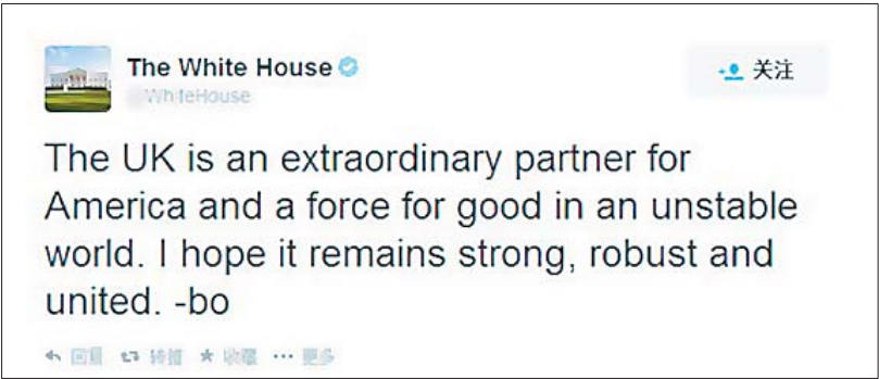
美国总统奥巴马18日凌晨3时34分发推特呼吁英国统一,内容为“英国是美国的卓越伙伴,并在当下不稳定的世界中是一支正义力量。我希望英国保持强大、稳定和统一。”末尾是奥巴马名字的首字母缩写。