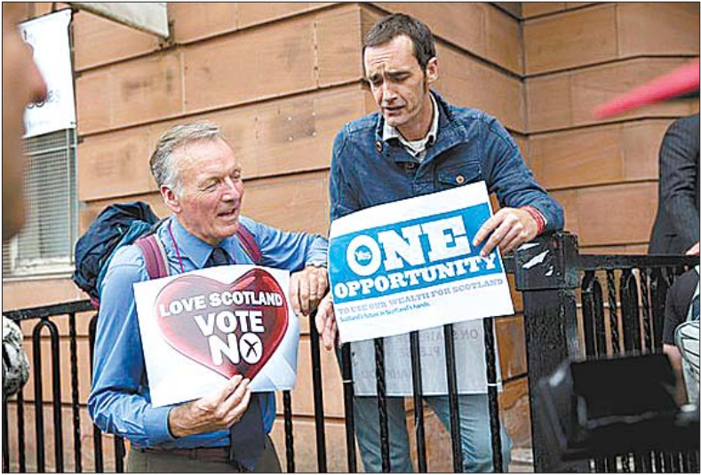
18日,在投票站外等候投票的两个苏格兰人分别手持支持和反对独立的标语。