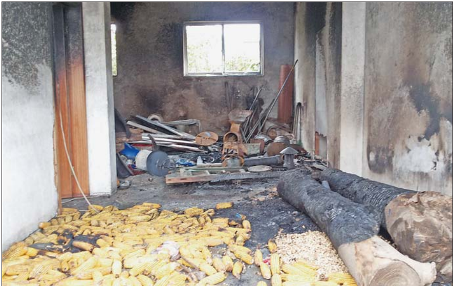
夫妻俩亲手盖起来的房子被烧得面目全非。

上9点,张芳可能是拿着汽油浇湿了衣服开始点的火。“应该就是因为夫妻俩吵架闹别扭了,她就闹自杀。她刚开始点了这个做饭,堆东西的屋,觉得不解气,又点了卧室和客厅,点完了还呆在屋里不出来。直到她被烧着了,才跑出去找人帮忙的。”