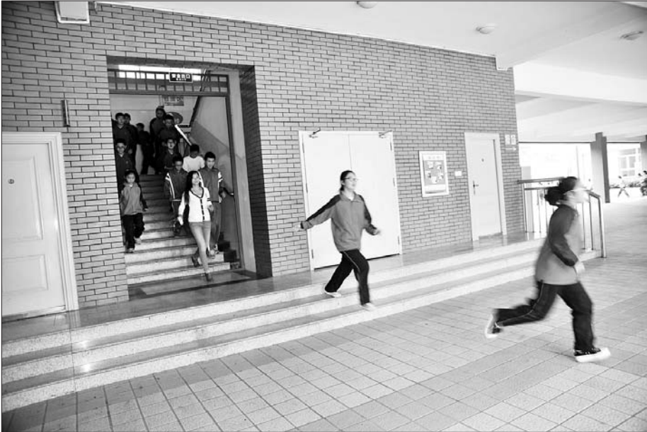
学生们快速跑出教学楼。

本报济宁9月18日讯(记者 晋森 汪洸 通讯员 付吉庆 刘镇 李文峰) 18日上午,全市“9·18”防空警报试鸣暨防空袭疏散演练举行。全市千余多所学校及部分小区、单位参与了活动。 “开始!”上午10点整,伴随着演习命令的正式下达,全市响起了防空警报声。在市人防民防指挥中心大屏幕上,交替显示着任城区苏州苑小区、金乡县第三中学和邹城市行政办公中心人员快速向外疏散的场景。 首先响起的是预先警报,警报响起后,任城区济阳街道运河社区苏州苑小区的群众关闭煤气,切断电源,携带应急包,在人防疏散志愿者的引导下从家中向小区人防工程疏散;金乡县第三中学的学生们听到防空警报后,在老师的带领下,迅速向操场、绿地疏散。预先警报的作用是预先告知敌人即将空袭城市,要求做好防空袭准备。 随后响起空袭警报,表明敌空袭兵器已临近城市,空袭即将或已开始,警告人们迅速隐蔽。苏州苑小区的居民转入人防工程内。邹城市行政办公中心模拟遭到空袭,浓烟四起。疏散至操场的中小学学生在听