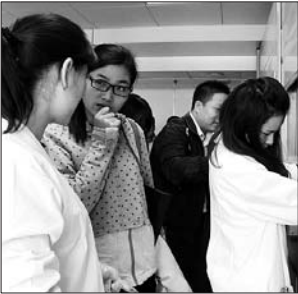
参观市民向检测人员咨询。