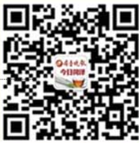
齐鲁晚报·今日菏泽官方微信二维码

这里有海量信息， 在这里能享受最新鲜、最全面生活资讯。 还等什么，赶快扫一扫下面的二维码吧。