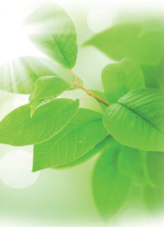
十届中国林产品交易会简要数据说明。

春季牡丹节、秋季林交会成菏泽展会经济“双响炮”。作为菏泽唯一一个国家级会展,十年历程走来,林交会见证了菏泽的发展与变化,也助推着菏泽经济走向更加繁荣。 当前,菏泽在《中原经济区规划》和《西部经济隆起带规划》国家与地方利好政策“叠加”下,必将迎来历史上发展的良好时机,也将带来无限商机。会展无疑为菏泽向外界打开一扇展示自我和推介自我的窗口,让更多的人来了解菏泽。 新的十年,林交会经济将为菏泽的发展带来无限遐想。