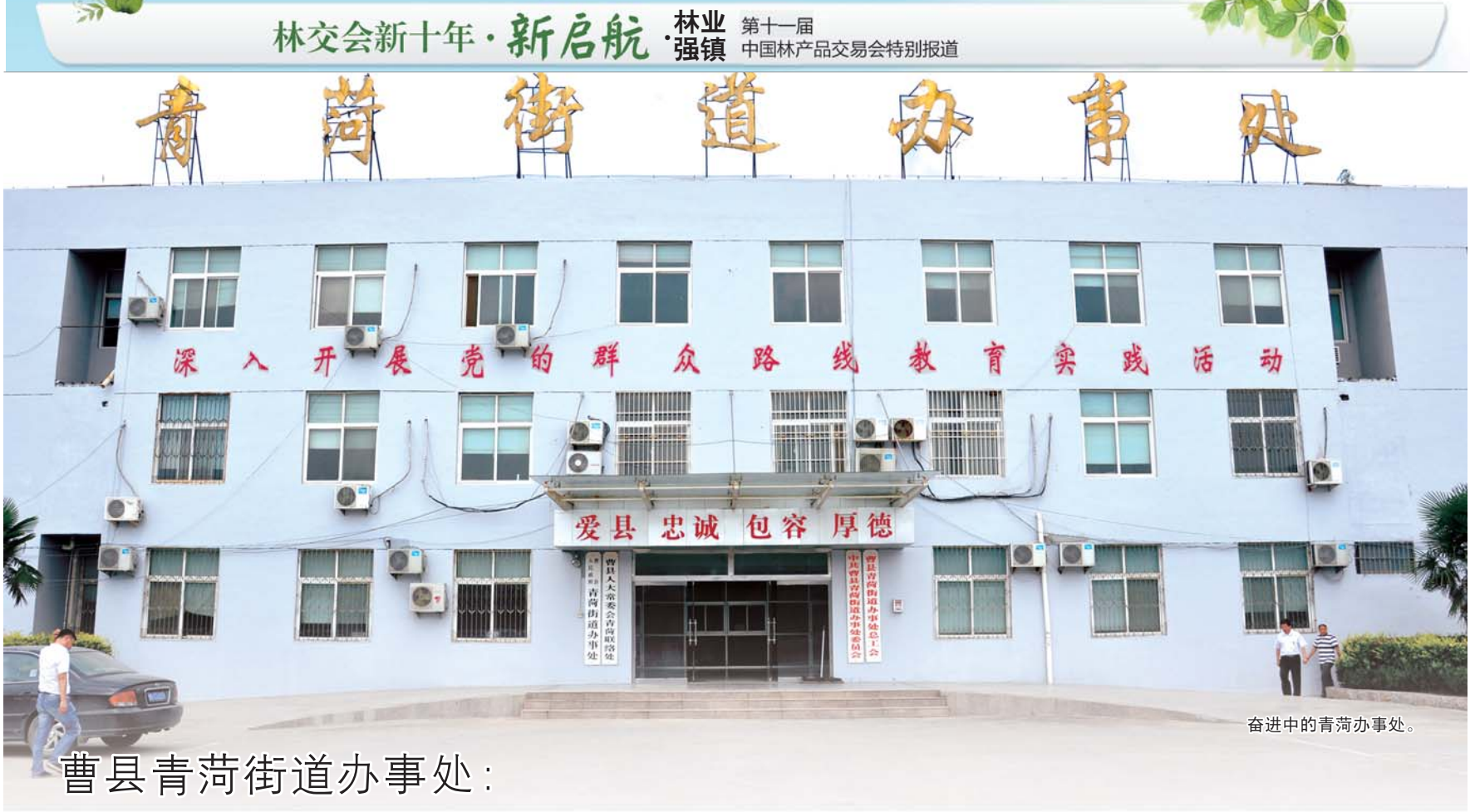
奋进中的青荷办事处。