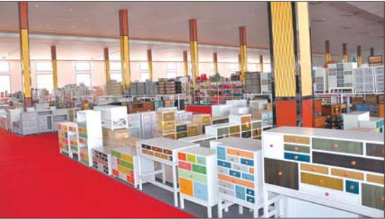
曹普工艺产品展示。