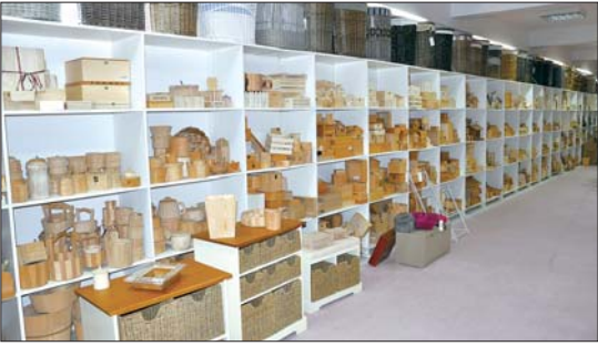
珠峰木艺产品展示。