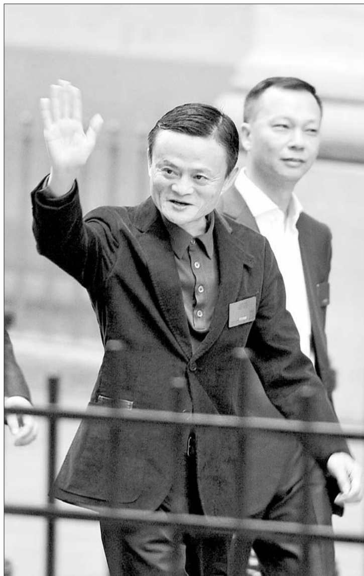
9月19日,阿里巴巴集团董事会主席马云在美国纽约证券交易所门前向现场投资人和工作人员致意。

他最后说道,“今天阿里融到的不是钱,而是信任!是所有人对我们的信任,客户的信任,时代的信任,投资者的信任。”