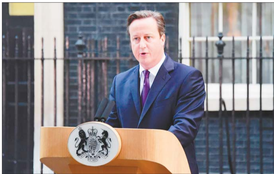
19日,苏格兰独立公投结果公布后,英国首相卡梅伦在伦敦唐宁街10号首相府外发表讲话。

综合新华社9月19日消息 苏格兰独立公投统计结果当地时间19日早晨(北京时间19日下午)揭晓,反独派和独立派得票率分别为55%和45%,投票率为84.48%。这意味着苏格兰独立被否决,仍将留在英国。