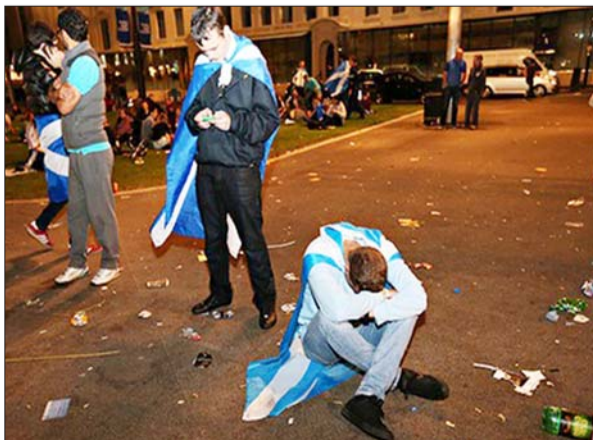
19日早晨,支持苏格兰独立的民众在公投结果公布后十分沮丧。