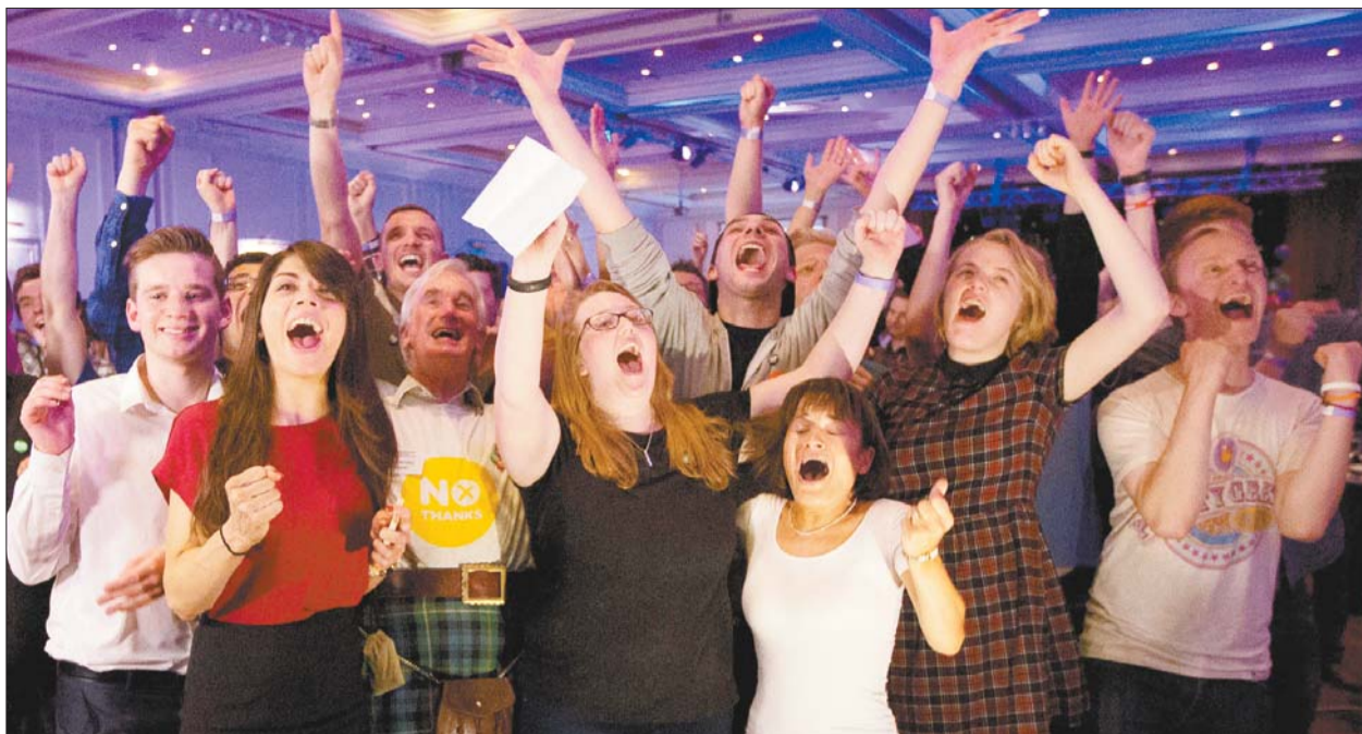
19日,在英国苏格兰格拉斯哥,反独立阵营的支持者在公投结果揭晓后庆祝。