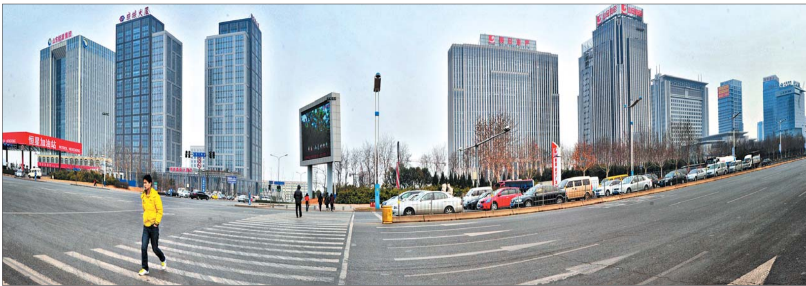
济南东部新城中央商务区,三分之二位于姚家辖区,将成为全市土地单位面积产出效益最高的区域。