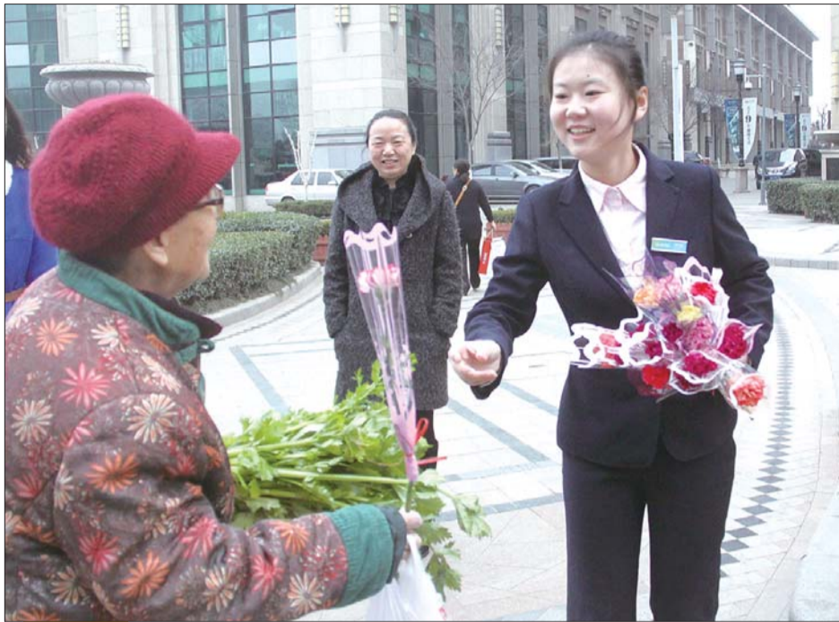
三八节为居民送上美丽的玫瑰花。

“三八妇女节”社区活动的开展,增进了物业与业主之间的感情,向广大业主展现了物业公司“贴心、细心、温馨”的服务理念,得到了广大业主的肯定。