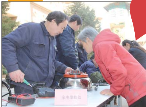
免费为居民维修家电。

另一组入户服务人员也按照名单开始了上门服务,为空巢老人打扫房间卫生,清理卫生死角,擦拭高处灯管等。同行的专业工程人员还为老人检查了用电、用水等方面的情况,现场排除安全隐患,确保老人有一个安全、舒适的居住环境。