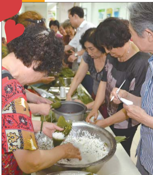
端午节包粽子大赛。