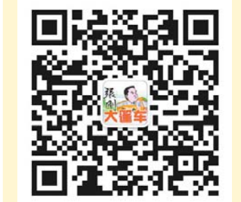
齐鲁晚报张刚大篷车官方微信

如果您思维卓越,愿为社区发展建言献策; 如果您热情洋溢,想亲力亲为给友邻服务; 如果您能歌善舞,愿为社区生活注入活力; 如果您文笔传神,能书善画,愿意为《新姚家》社区做贡献力量; 或者,您一专多能,愿意向社区身边人展示和分享; 又或者,您已感受到社区生不生息的律动与活力…… 那么,快快加入我们吧! 我们为您提供多种“加盟”方式: 您可以拨打齐鲁晚报热线96706126或发送邮件至qjwbpc@163.com,告诉我们您的意向;您也可以加入“姚家人”qq群(群号298100133)交流;您还可以关注齐鲁晚报张刚大篷车微信(微信号qiludapengche),说出您所思想。