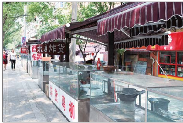
▲改造后的甸新南路。