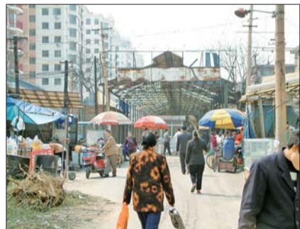
◀改造前的吉祥苑市场。