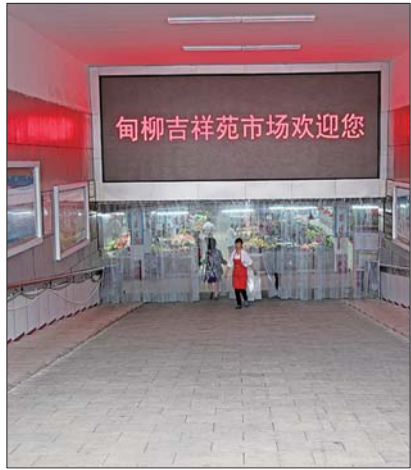
吉祥苑农贸市场正在向“超市”方向靠拢。