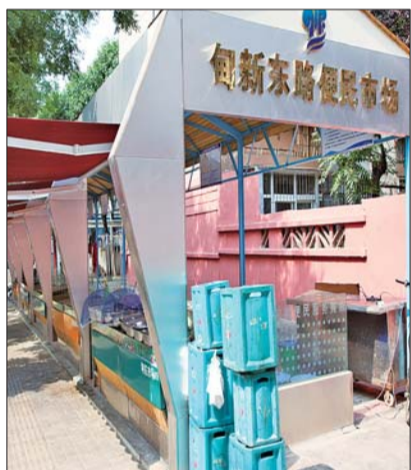
甸新东路便民市场改造后,焕然一新了。