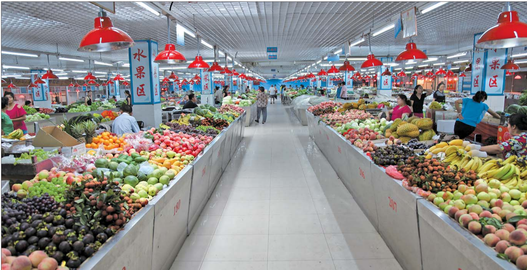
吉祥苑农贸市场,是济南首家社区室内副食品绿色市场,并被商务部评为“全国社区商业示范社区”。