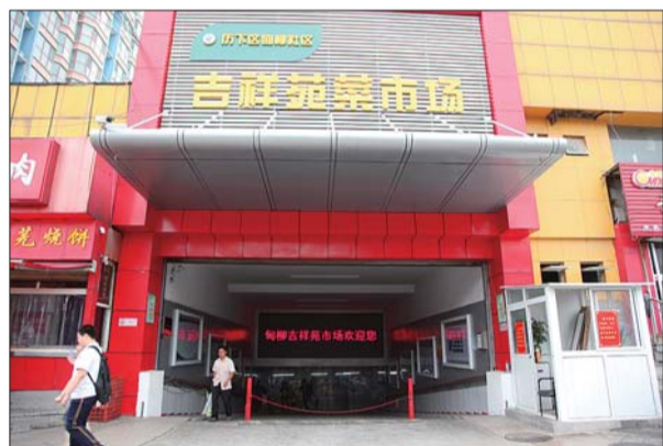
▲改造后的吉祥苑市场。