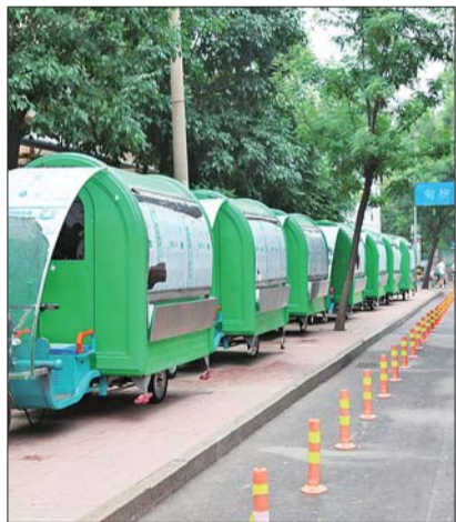
甸柳第一社区居委会西侧“早餐街”如今整洁有序。