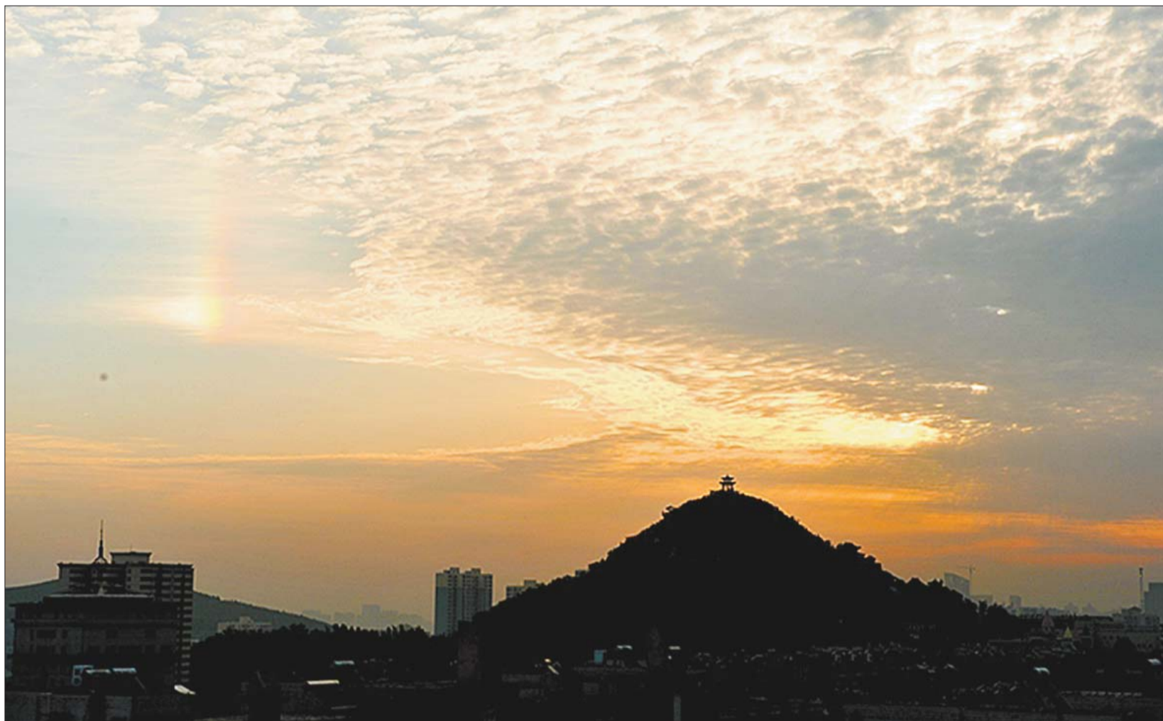
作品:《吉祥苑祥云》 作者:高强(吉祥苑社区) 山东省摄影家协会会员