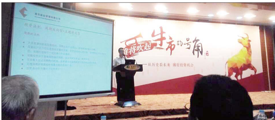
某基金公司在济南举行投资报告会,现场气氛热情高涨,仿佛牛市铁定到来。