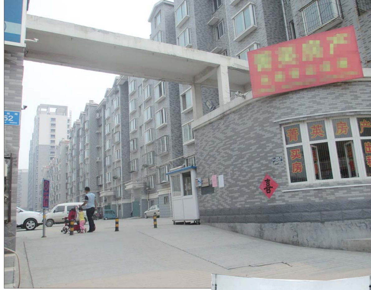
鼎舜赵苑为供热自管站小区,共有5000户居民。

也无权管辖。济南市供热办相关工作人员向记者介绍,根据最新的供热条例,“今年供热报停费不再收取。”济南市供热办已经要求所有的供热企业今年不再收取报停费,“但对管理自管站的物业等单位,没有管辖权。”