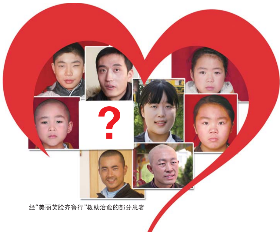
经“美丽笑脸齐鲁行”救助治愈的部分患者