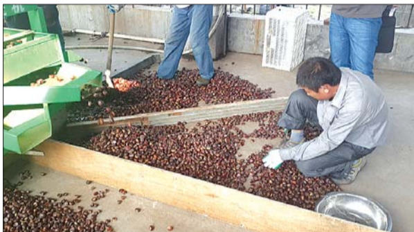
收购站工作人员在挑选栗子。

入来源,全镇板栗加工企业共有8家,其中4家为市级龙头企业。“去年板栗产量为8000吨,原来收购价格一般在3到4块钱,通过申请农产品地理标志,板栗价格上来了,每斤收购价格可以稳定在6块钱左右。”尹主任表示,在带来巨大收益的同时,还要在板栗深加工方面做文章,进一步提高农民收入。泰安板栗协会王雅红会