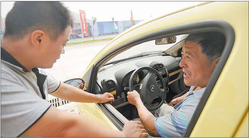
客户试驾电动汽车。

百姓车王争霸赛是齐鲁汽车生活广场主办的大型汽车场地竞赛活动,面向全城热爱汽车驾驶的百姓募集报名。记者了解到,齐鲁汽车生活广场将每周进行场地单元竞赛,现场将设置比赛区域,选手用最短的时间通过障碍