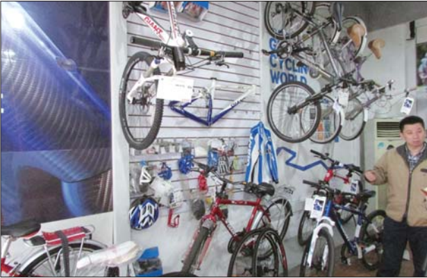
山地车经销商介绍车辆发展历史。

随着市民时尚意识与健身意识的提高, 山地车骑行这种新兴的运动方式, 在济南越来越广地为市民所关注。国庆假期来临, 不少市民准备骑山地车出行旅游。在健身、游玩的同时, 由于山地车速度过快, 带来的危险也不容忽视。