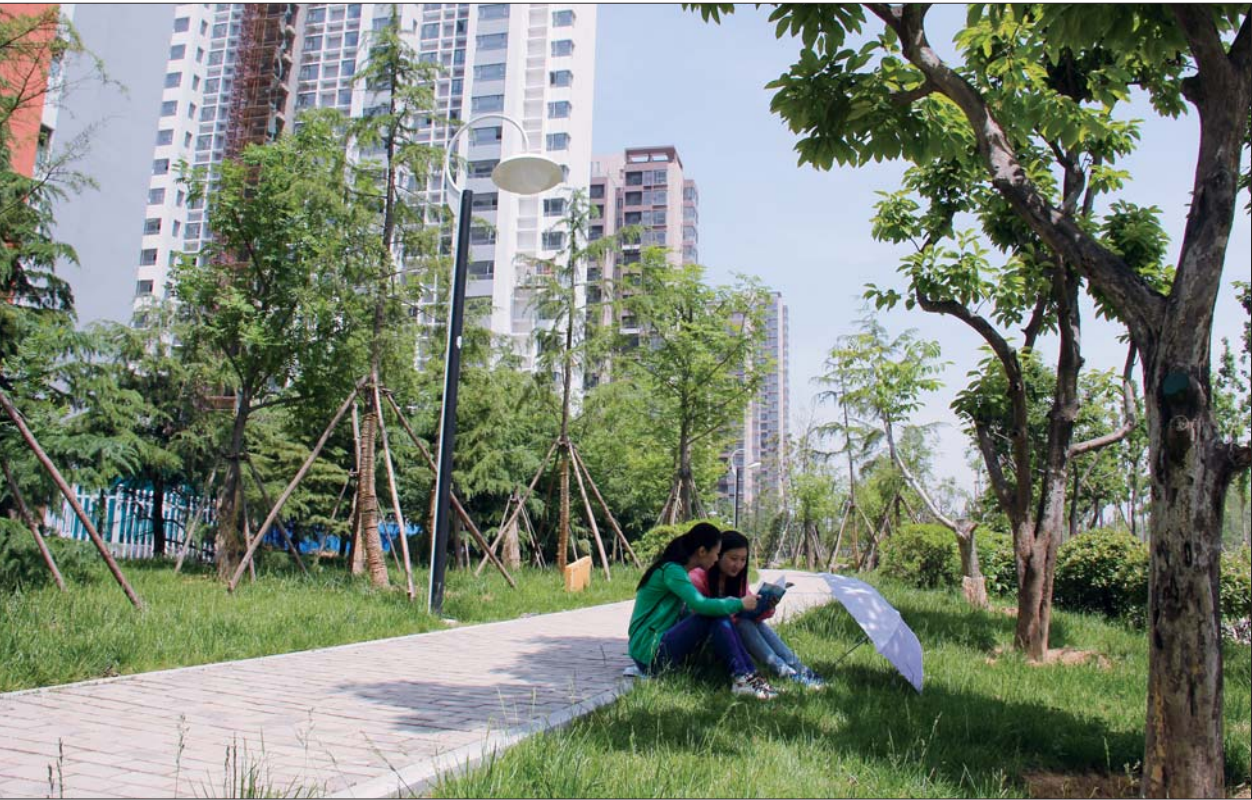
在优美环境中学习,竞争力才更强。

曾因煤炭而闻名遐迩的邹城,近年来在转型道路上更加注重发展质量和效益的提升,以实现城市的可持续发展为目标,大力构筑节约能源资源和保护生态环境的生态产业结构,以绿色竞争力撬动“和谐幸福新邹城”的发展杠杆。