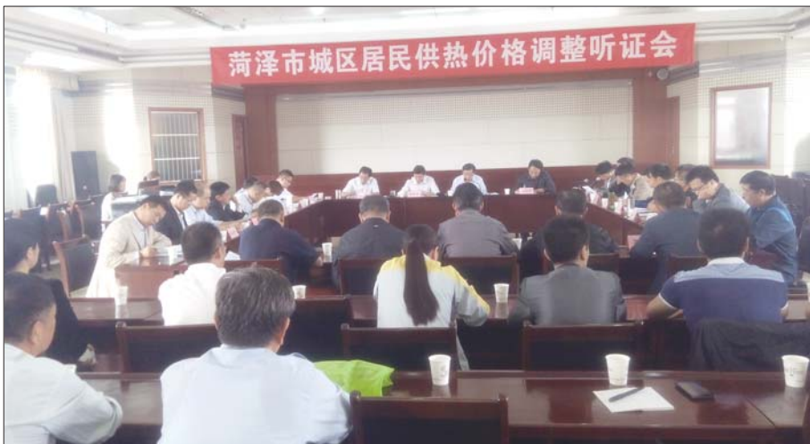
菏泽市城区居民供热价格调整听证会现场。

洪常存建议政府和热力公司用一到三年的时间要加快对既有小区的供热设施直供到户改造步伐,对新建居民住宅小区和那些未集中供暖的小区 and 部