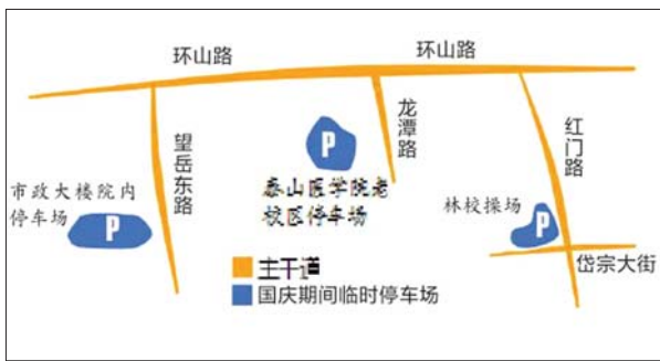
三处临时停车场的位置。