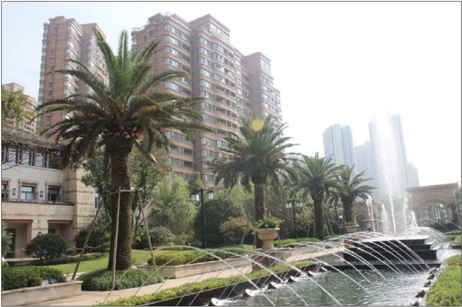
长沙五矿万境水岸。

作为全球500强中国五矿的下属企业,五矿地产始终秉承“有限空间 无限遐想”的核心理念,谋求城市发展,为大家构筑品质生活,同时一直吸引着中国各地购房者的目光。9月22-24日,本报记者同泰城多家媒体一起前往湖南,考察了五矿地产的多个项目,真切感受到这个一流房地产企业的实力,并对五矿地产在泰城的发展有了新的认识。