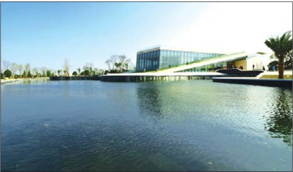
湘潭五矿万境水岸。

2010年3月28日,五矿嘉盛国际广场开盘当日热销1.8亿元,创下公司最佳销售记录和长沙楼市同类产品均价最高纪录,更是制造了长沙楼市销售神话;2011年4月23日,五矿格澜郡开盘,当日成功认购256套,实现销售1.35亿元;2011年12月3日,首个标准化系列产品——五矿万境水岸项目示范区和会所盛装揭幕,首度开放面市,当日解筹率83%。如今,在湖南,五矿地产毫无疑问地成为湖南房地产市场的一匹黑马,成为湖南高品质住宅的标杆。