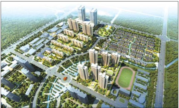
泰安五矿万境水岸。