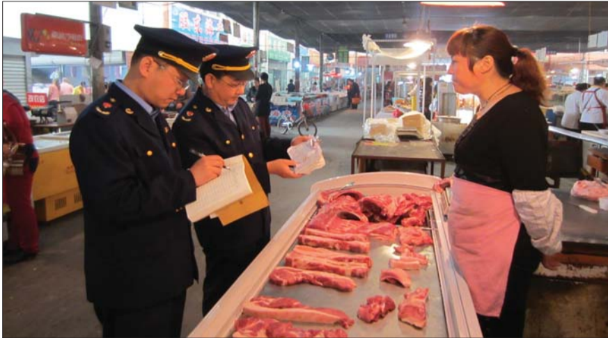
临淄工商分局工作人员正在检查猪肉(资料片)。