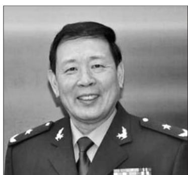
军事专家罗援少将