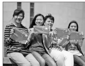
四名山东大学学生手持国旗。