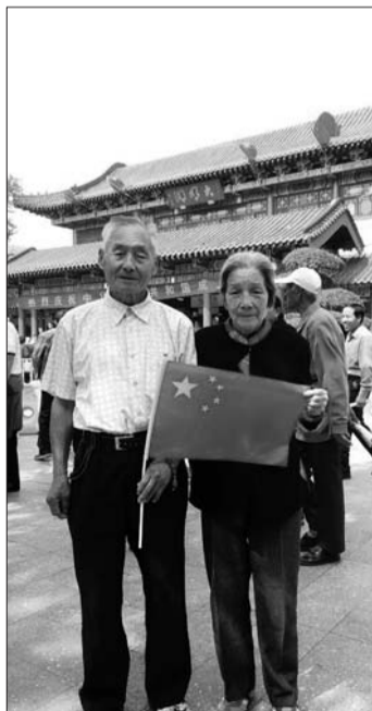
年近九旬的老人在国庆节迎来钻石婚。

卢沟晓月太行刀, 金陵碧血延水谣。 哀歌悲饮千滴泪, 狂飚怒掀万重涛。 倭奴再拾武士道, 打鬼重吹集结号。 立马横枪今又现, 弯弓备箭射邪妖。