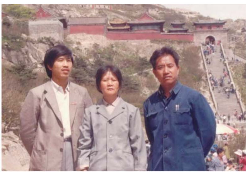
1984年,苏先生(左)与父母第一次在泰山上合影留念。