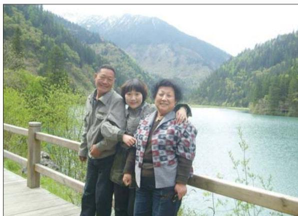
2012年5月,网友“乌拉草”与父母在四川九寨沟一处湖水前留影。

1日,本报刊登了于先生一家人相隔30年之久的照片。网友“岱岳山人”也联想到自己的父母。他也发现了两张与父母登泰山的合照,非常巧的是,这两张照片也恰好相隔30年。