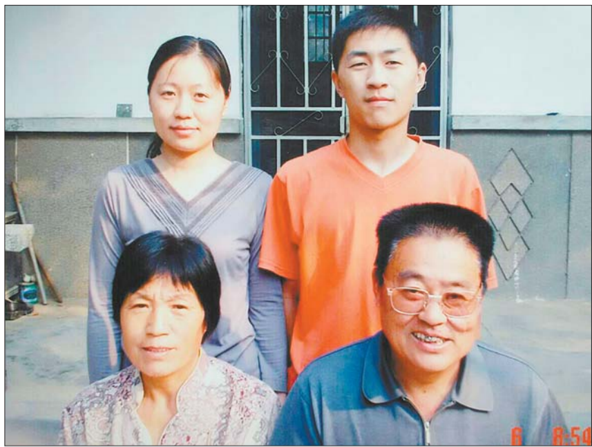
八年前程女士全家的合影(后排左为程女士)。