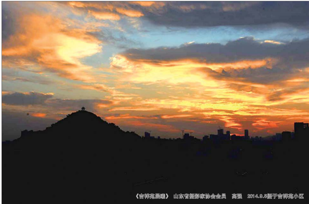
《吉祥苑晨曦》 山东省摄影家协会会员 高强 2014.9.5摄于吉祥苑小区

百合:百合不仅有良好的营养滋补作用,而且有润肺、清心安神的功效,还能提高宝宝的睡眠质量,让宝宝睡得更香甜。百合可煮粥、煮糖水、蒸和炒,百合银耳粥具有滋阴润肺、健脾生津的作用。适合年龄:6个月以上。