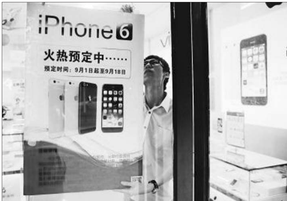
一家商店贴出的iPhone6海报。(资料片)

而在宣布苹果新品的内地销售时间后,据不完全统计,在三大运营商接受预订后的6个小时内,预订量已经超过了100万部。