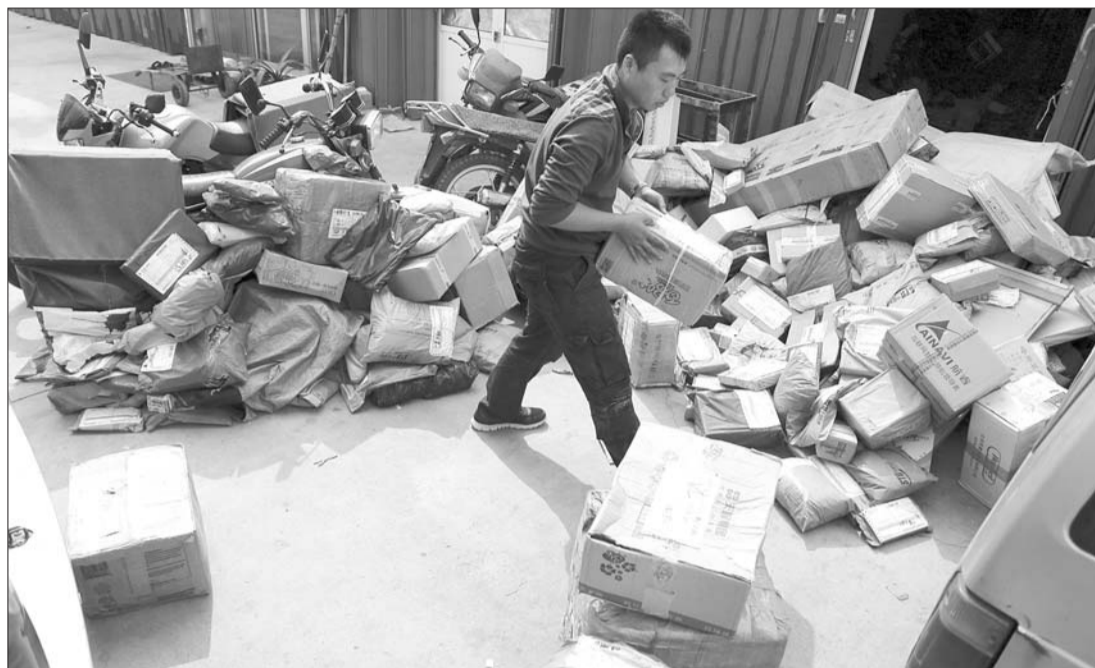
“十一”期间,很多企业休班,不能送快件。8日开始上班后,快递员加班加点送件,忙得不可开交。

本报10月8日讯(记者 李静) “十一”期间,大部分企业不上班,快件无法及时签收,导致快递公司堆积了不少存货。节后上班首日,需要派送的量达到平时的两三倍,翻倍增加的快件让快递员忙得不可开交。 8日早上7点多,快递工作人员勇鹏已经在送快件的路上。如果企业能早上班,他恨不得更早点,因为要派送的快件太多了,除了下午要拉回来的