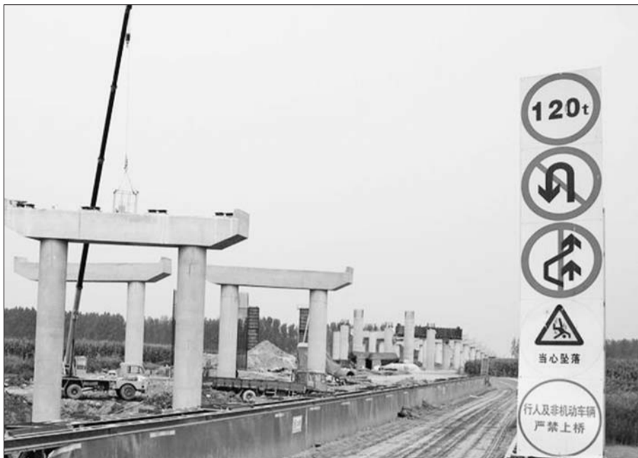
正在建设中的德商高速公路。

记者了解到,德商高速公路夏津至聊城段是山东省“五纵四横一环八连”高速公路网中的“纵五”及“一环”的重要组成部分,也是国家高速公路网中G3W德上(德州—上饶)高速公路的重要组成部分。在建的德商高速公路分为三段,其中夏津至德州鲁冀界为北段,夏津至聊城为中段,聊城至范县(鲁豫界)为南段。德商高速公路中段自德州市夏津县田庄乡张庄东的夏津西枢纽互通立交起,往北与德商公路德州至夏津段(即德商高速公路北段)相接,向南途经夏津县、临清市、东昌府区,至于东昌府区道口铺办事处安庄西聊城西枢纽互通立交,路线全长62.128公里,其中聊城市境内49.128公里。南段向北与中段相接,向南途经东昌府区、阳谷县、莘县,止于鲁豫省界,全长68.8公里。正在紧张建设的德商高速公路聊城段,纵贯聊城临清市、东昌府区、阳谷县、莘县4个县(市、区)。聊城市公路局相关负责人介绍,根据省交通运输厅的安排部署,德商高速公路聊城段分两段进行建设。其中南段由省