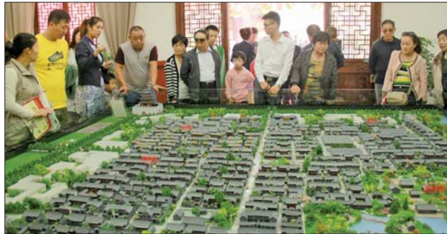
国庆节期间,市民正在东昌御府展示中心内看房。

东昌御府的建筑细节之美,体现在门口安放的抱鼓石,体现在为排水而设计的坡度屋顶,更体现在青砖、红砖结合运用,保