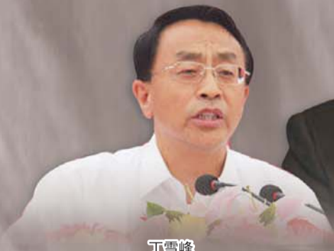
丁雪峰 (原吕梁市市长)