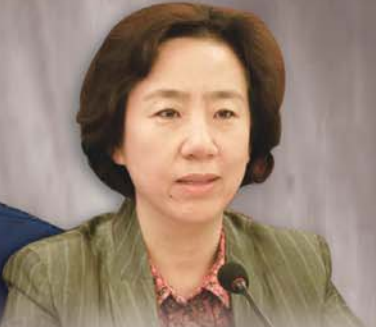
白云 (原山西省委常委、统战部长)