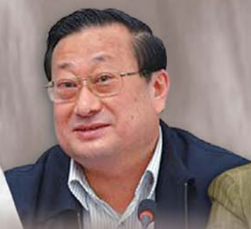
聂春玉 (原山西省委常委、秘书长)