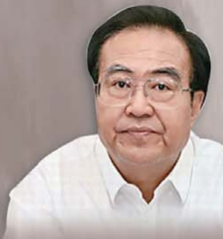
杜善学 (原山西省委常委、副省长)