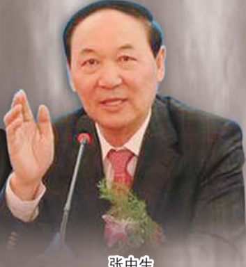
张中生 (原吕梁市副市长)