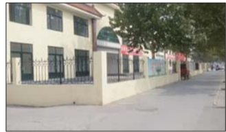
综合市场院墙占据人行道。

历城区城管局二中队的工作人员称,该处为祝甸居委会按照相关要求对市场进行提升改造设置的院墙:“这个围墙设置确实有点大,如果相关部门没什么批示,就属于违章建筑,应该是要拆的。”历城区城管局表示,如果实在影响市民出行,可以和办事处联合整改。