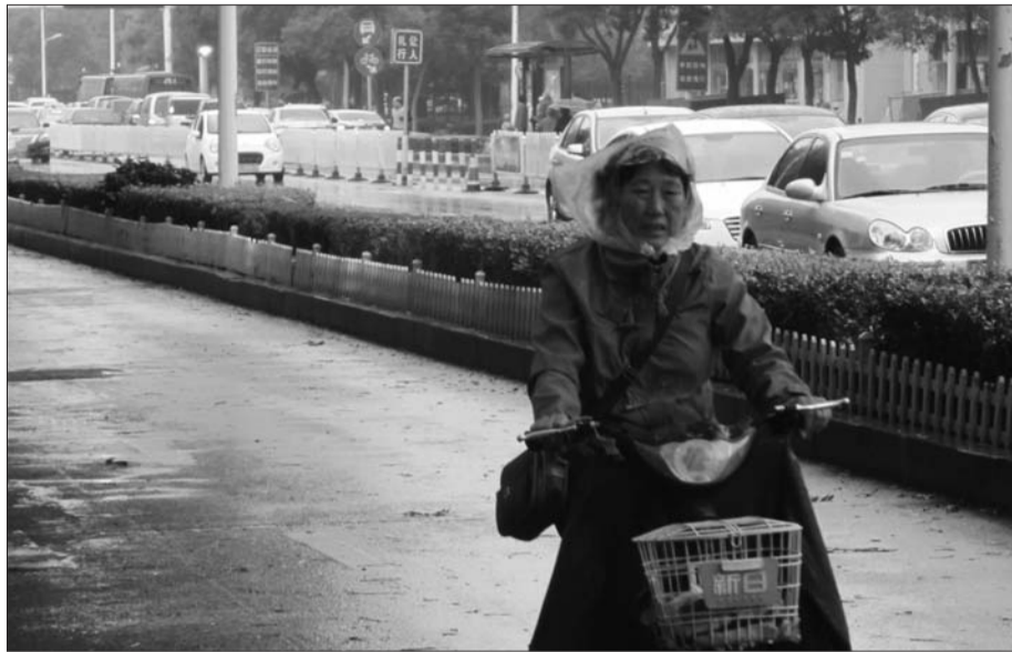
12日早上,突来的降雨让很多市民猝不及防。

气象部门预计,13至14日,受西北气流影响,天气晴好为主,但气温较低,14日,最低气温将降至4℃,可能出现轻霜冻天气;16日、19日还将有两次冷空气过程,届时温度将进一步下降,最低温持续在10℃以下,尤其是19日到来的冷空气,还将伴随一次较大的