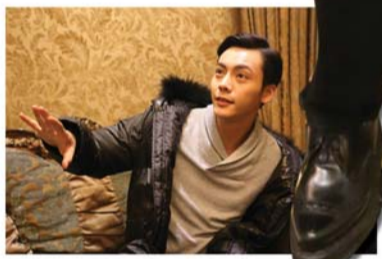
陈伟霆说喜欢烟台的海和新鲜空气,也爱烟台的粉丝。本报记者 韩逸 摄