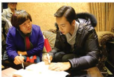
陈伟霆为本报读者签名送祝福。