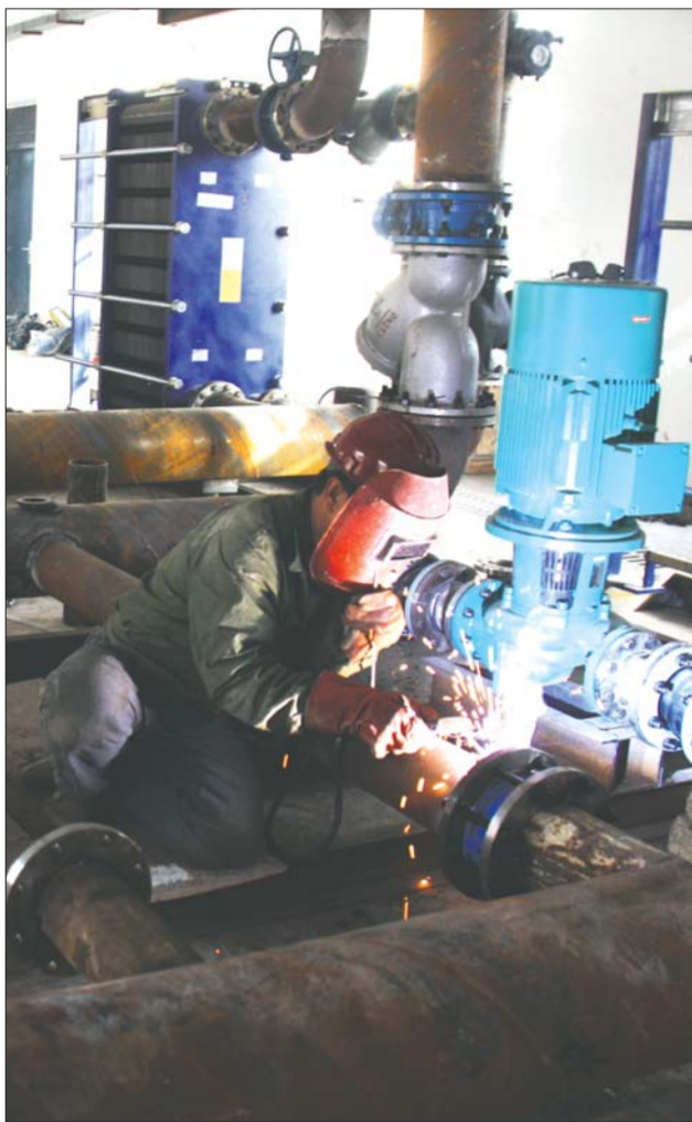
10月15日,经济技术开发区玫瑰公馆内施工人员在修建新的换热站。

下一步,将积极协助供热企业与热源企业在冲管、管网注水、冷热循环、供热运行等方面做好衔接。实行包片责任制,明确责任,狠抓落实,及时协调供热企业和有关单位解决小区居民供热问题,确保中心城区供热工作有序推进,确保居民温暖过冬。