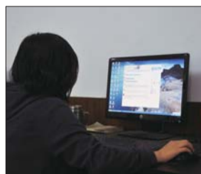
网恋被不少年轻人所追捧。

“从干预沉溺网恋者的角度来说,最关键的是将注意力转移到现实中来,这时候他身边的亲人便尤为关键。”淄博稷下心理研究中心主任心理咨询师沈艳英介绍,沉溺网恋者孤僻的性格往往成为他继续逃避现实的原因,通过身边人的关注与引导,让他们更多参与团体活动,享受到现实生活中人际交往所带来的快乐。或者鼓励他们通过网络恋情延伸至现实生活。