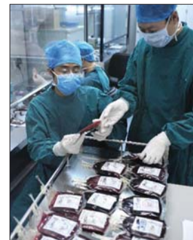
山东省脐血库工作人员接收脐带血。

所以,无论捐献脐带血还是自存脐带血,必须委托国家批准的正规脐血库才可以得到合法合规安全高质的保障,才能够确保未来一旦使用时,可以获得移植医院的使用。而非正规血库储存的造血干细胞或者其他细胞,没有任何医疗机构会接受使用。