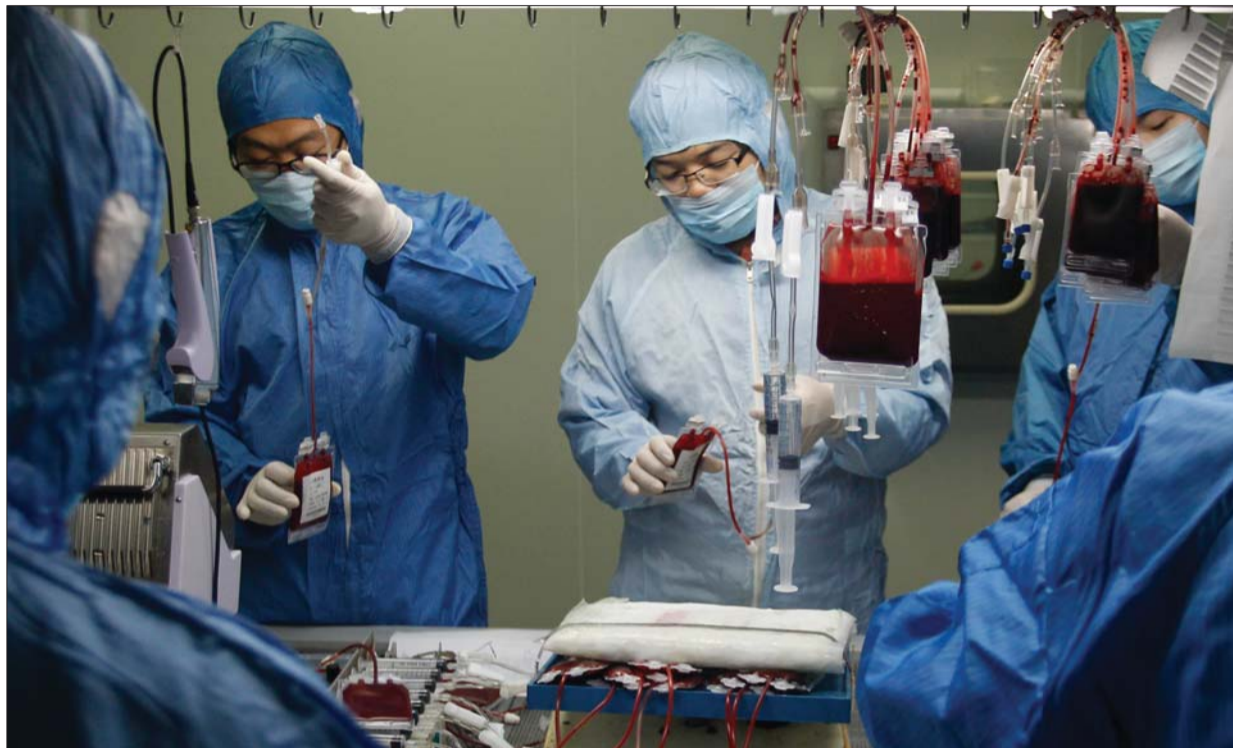
工作人员将细胞保护剂注入脐血袋。

本报讯 近年来,一向陌生的词汇“干细胞”渐渐进入公众视野。“骨髓造血干细胞移植”、“脐带血造血干细胞移植”、“脐带血储存”……很多与干细胞相关的新闻报道见诸各媒体。然而,并不是所有的“干细胞”都可用于临床治疗,目前仅“造血干细胞”应用技术成熟。