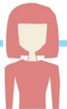
股民黄女士 股龄:14年 炒股感言:不盲目割肉,多向别人学习

不过,他到现在也没打算离开股市。作为股市的痴守派,他说虽然6124点重现不知道得何年月,但是他都会在里面摸爬滚打。