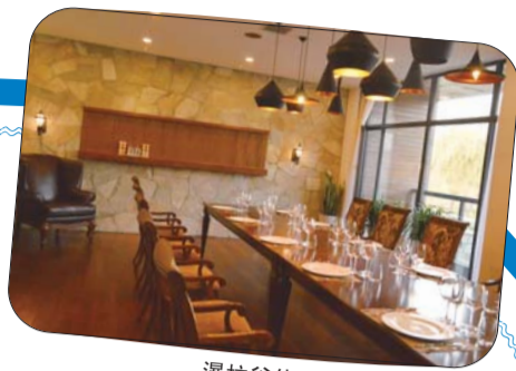
瀑拉谷体验中心西餐厅