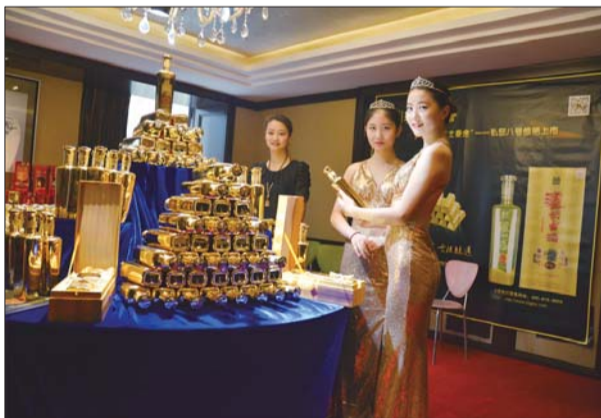
泸州老窖古酒私邸八号“土豪金”

鎏金的瓶子充满着最时尚的气息,醇正的酒香散发着幽幽诱人的味道。性格豪爽的人,自信满腔,张扬率直得从不隐藏自己的喜好和内心。“土豪金”酒正满足了这些人群的心理和需求。每天努力拼搏的人,不正是向往着这种自由的生活和成功的结果,为令人羡慕的成就而奋斗。爱酒人士喝时尚独特的名酒,在朋友聚会或是商务宴请时举杯畅饮,共度美好的夜晚。爱酒人士喜欢在人们羡慕的目光和尖叫声中开启独爱私邸“土豪金”酒。更喜欢