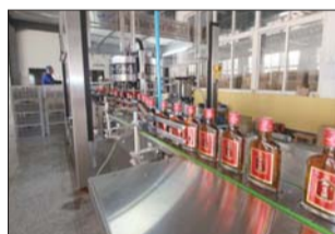
工厂正在加紧生产