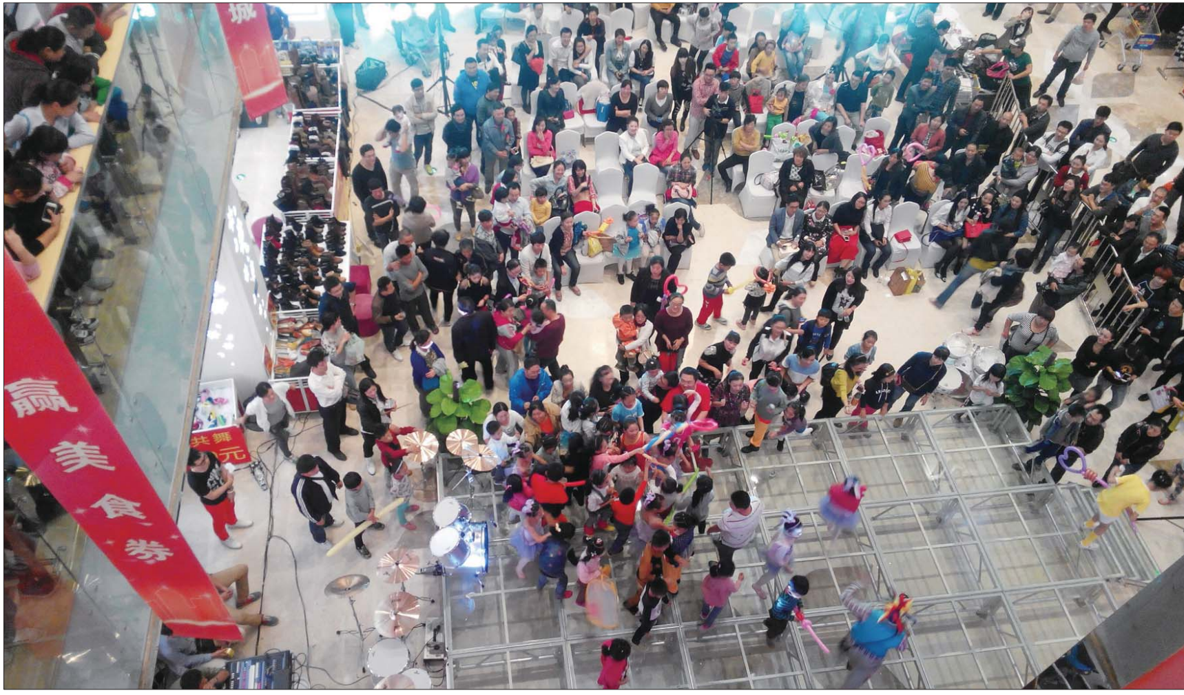
▲东部的丁豪广场周末经常搞各类活动,吸引人气。

部、南部也开始有了自己的城市综合体。2012年4月,泉城路上4万平方米百盛广场开业,主打“精致、年轻、时尚”的市场定位,200余个品牌,不少直接来自百盛独家合作品牌,但在今年5月时关门。 2013年9月,南购物新地标8万平方米购物中心中海环宇城开业,在二环南路上属独一家,带来了全世界最大的孕妇、婴童童商品连锁品牌“moth-ercare”和快餐品牌“汉堡王”。今年3月底,泉城路世茂广场和装饰一新的老东门购物中心开业,4月高新区10万平方米购物中心丁豪广场开业,稍微缓解了高新区不断增多的年轻一族购物休闲需求,9月高新区新派大街和颖秀路附近,又新增一个总建筑面积达5万平方米,主打阅读主题的美莲广场。 2010年1家,2011年2家,2012年1家,2013年1家,2014年5家。今年城市综合体数量猛升,其中主要集中在高新区,“逛街没地儿选”已经成了“今天要去哪儿逛”,一线品牌在济南市民眼中已经不再是稀罕事儿,逛泉城已经不再只是逛趵突泉、大明湖,泉城广场,而更多是集建筑和舒适的休闲空间于一体的购物“广场”。