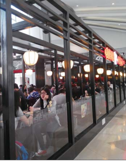
▲城市综合体内的餐馆人气很旺,但购物专卖店人气不足。