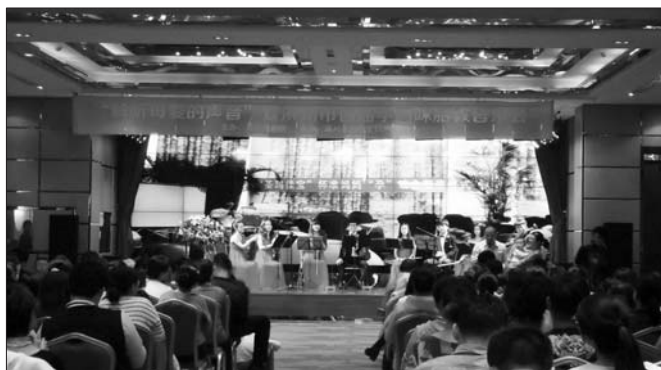
滨州首届孕妈咪胎教音乐会开演。

本报10月19日讯(记者 代敏 通讯员海鹰) 18日下午,由滨州市妇联主办,滨州圣玛佳宝妇产医院承办的滨州市首届大型公益胎教音乐会在滨州市青藤苑大饭店盛装开幕。