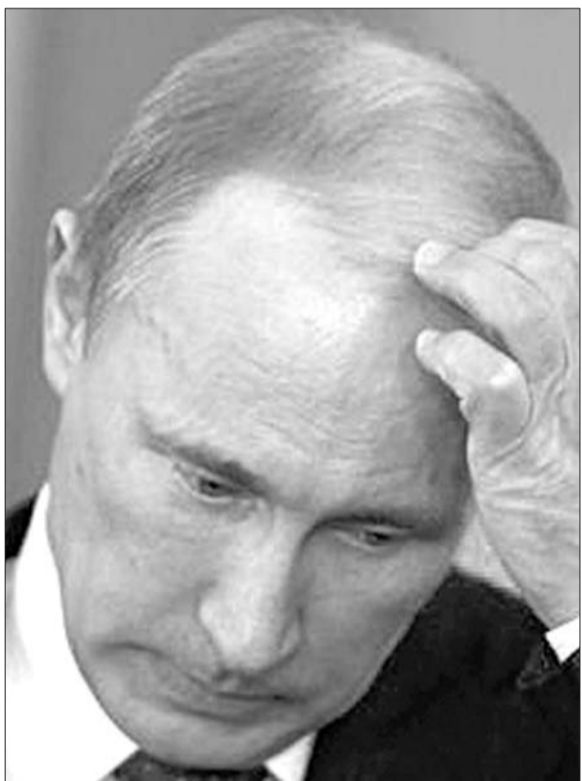
曾经放言不怕欧美制裁的普京,面对油价下跌确实有点急。

美国穆迪投资者服务公司17日下调俄罗斯信用评级,把俄罗斯主权信用评级从Baa1级下调至Baa2级(倒数第二级),前景展望维持负面。有分析认为,俄罗斯经济目前所面临的重大困难,是油价下跌所造成的财政困境。据计算,如果油价维持每桶80美元至90美元水平,俄罗斯经济可以支撑大约两年。