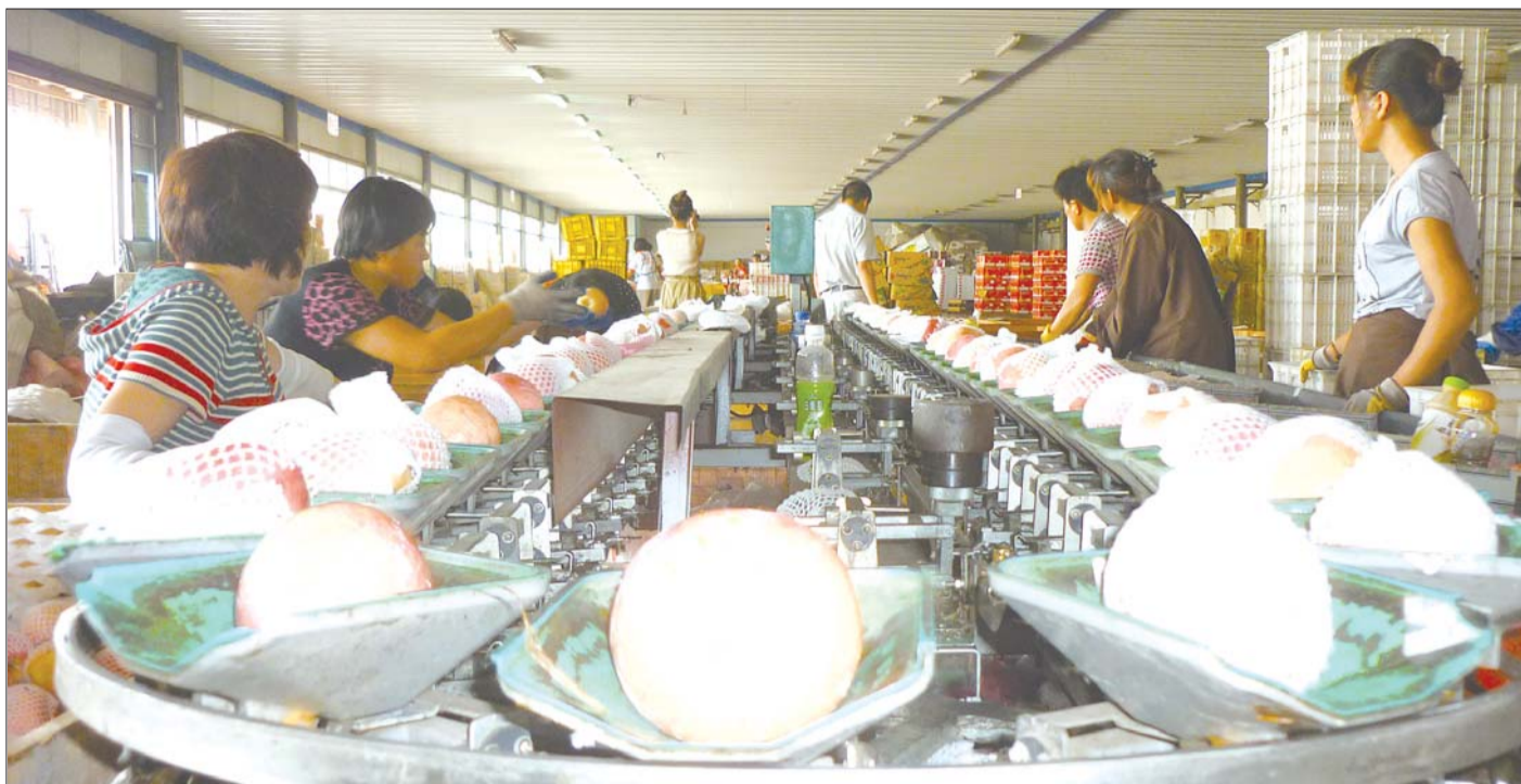
用苹果分选机作业,工作人员只负责添加和收集苹果即可。