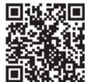
本报官方淘宝店二维码

2.我们开设了官方淘宝店,市民只要登录淘宝网,搜索店铺“烟台农产品之家”(本报官方淘宝店网址http://