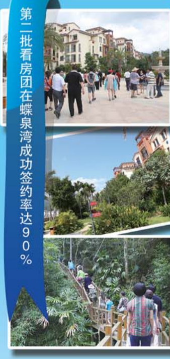
第二批看房团在蝶泉湾成功签约率达90%