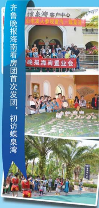
齐鲁晚报海南看房团首次发团,初访蝶泉湾